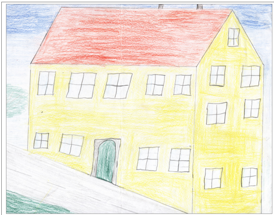
Likovni rad – Leo Žagar, 5. razred