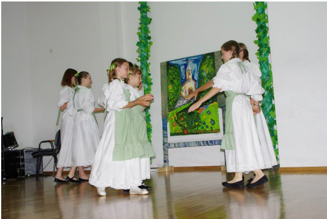
Nastup folklorne skupine „Skračka deca“

Budući da je sama izložba bila zamišljena i pripremana na visokom znanstvenom nivou, udruge koje se bave kulturnim djelatnostima usmjerenima na djecu pripremale su popratne sadržaje za samo otvorenje izložbe. Tako je folklorna skupina „Skračka deca“ koja okuplja djecu u osnovnoškolske i srednjoškolske dobi za otvorenje izložbe „Rođenje Skrada“ pripremila prigodni program. U tom programu izveli su tradicionalne goranske plesove „Tri koraka“ i „Špic polka“.