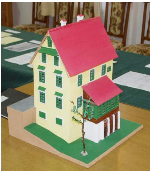
Maqueta kuće Lončarić

Kao aktivnost koja će biti zaključak ove naj-akcije zamišljeno je stvaranje bojanke „Stara hiša“. U toj bojanke, uz fotografije starih skradskih kuća nalaze se likovni i literarni radovi učenika na temu „Stara hiša“.