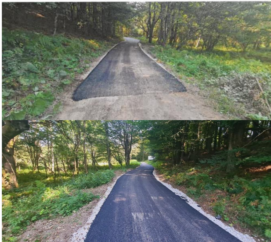
Slika. Rekonstrukcija postojećeg puta u ulici Veliko Selce