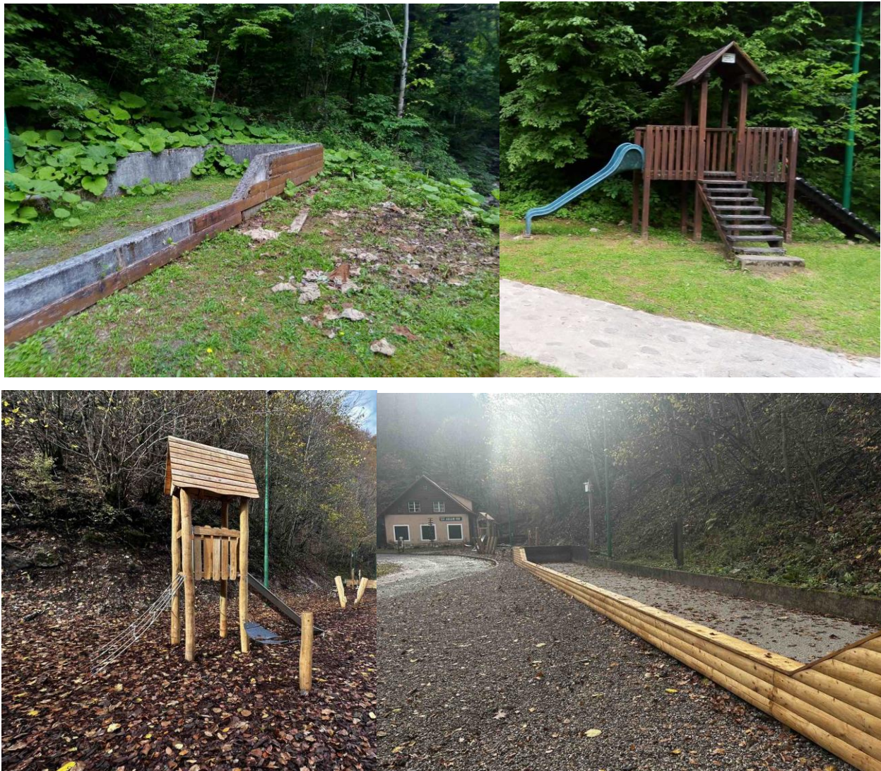
Slika. Uređenje prostora ispred Planinarskog doma Zeleni vir (prije-poslije)

Što se tiče rekonstrukcije ceste za Zeleni Vir nakon brojnih sastanaka i pripremi radnji, sporazumno je dogovoreno da će sve potrebne radnje u vezi rekonstrukcije dobiti Hrvatske ceste.