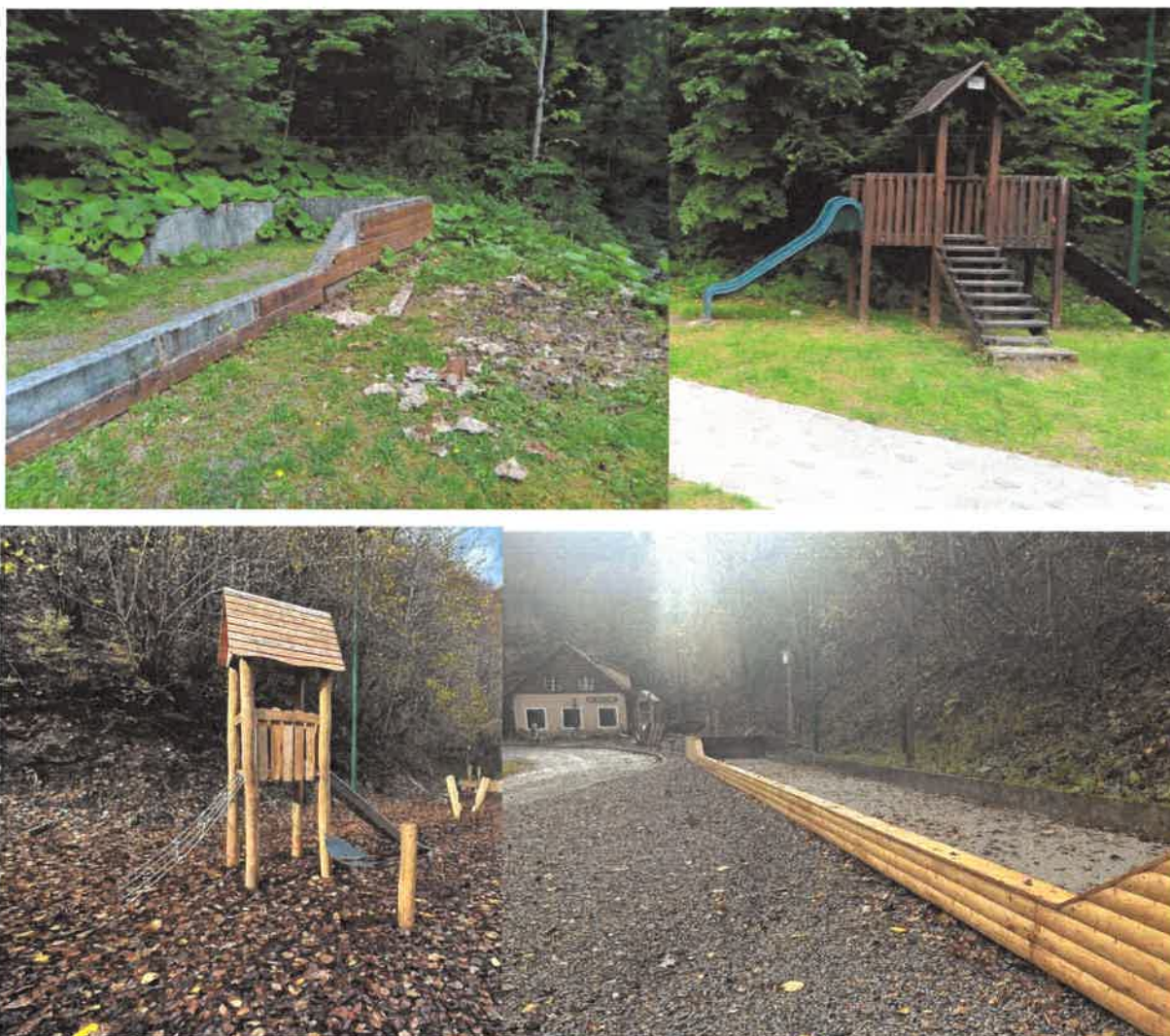
Slika. Uređenje prostora ispred Planinarskog doma Zeleni vir (prije-poslije)

Što se tiče rekonstrukcije ceste za Zeleni Vir nakon brojnih sastanaka i pripremih radnji, sporazumno je dogovoreno da će sve potrebne radnje u vezi rekonstrukcije dobiti Hrvatske ceste.