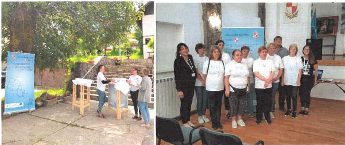
Slika: Info dan i Završna projekcija projekta „Zaželi kvalitetniji život“

Projekt je sufinancirala Europska unija iz Europskog socijalnog fonda