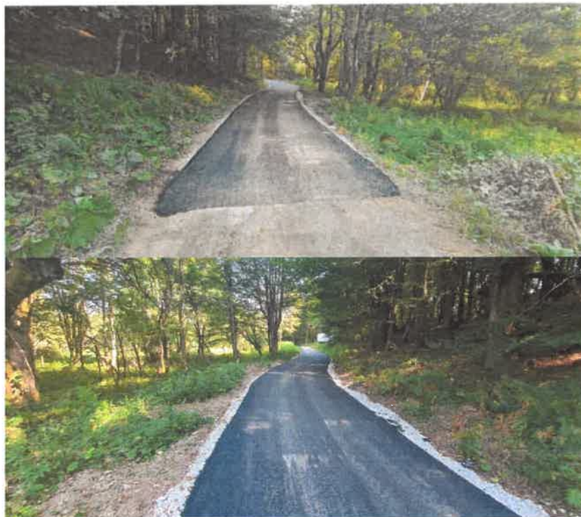
Slika. Rekonstrukcija nerazvrstane ceste Gornja Dobra-Brezje-Pečišće (II. faza)

Izvršena je rekonstrukcija postojećeg puta u ulici Veliko Selce za što je dio sredstava osiguran iz Proračuna Primorsko-goranske županije.